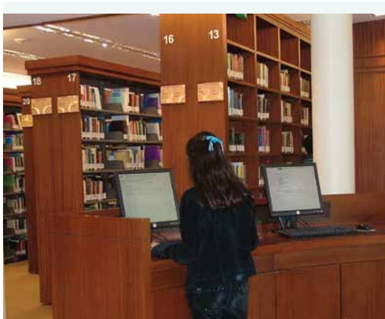
Biblioteca Raúl Baillères Jr.